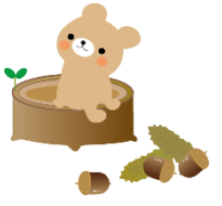
イラスト:わんバク